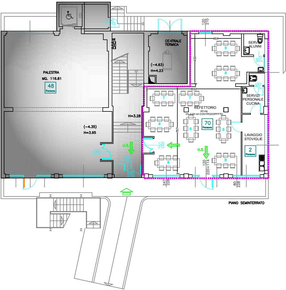
STRALCIO PIANTA LOCALE REFEZIONE PIANO INTERRATO